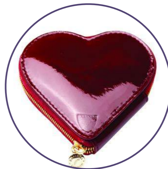
Кошелек для монет