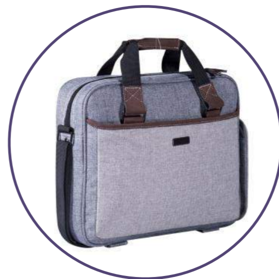
Сумка для ноутбука