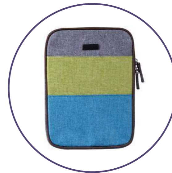
Чехол для iPad