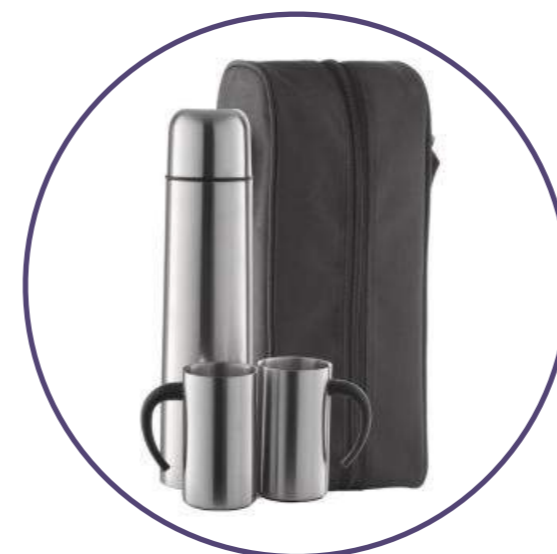
Термос и 2 кружки