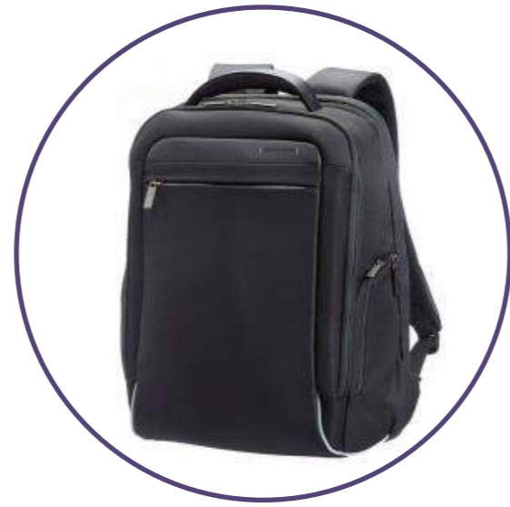
Рюкзак для ноутбука