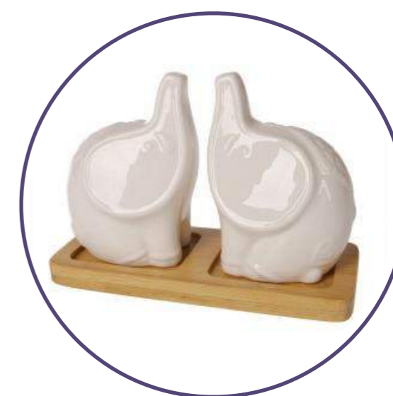
Набор для специй

И еще более тысячи вариантов товаров в каталоге brandship.me