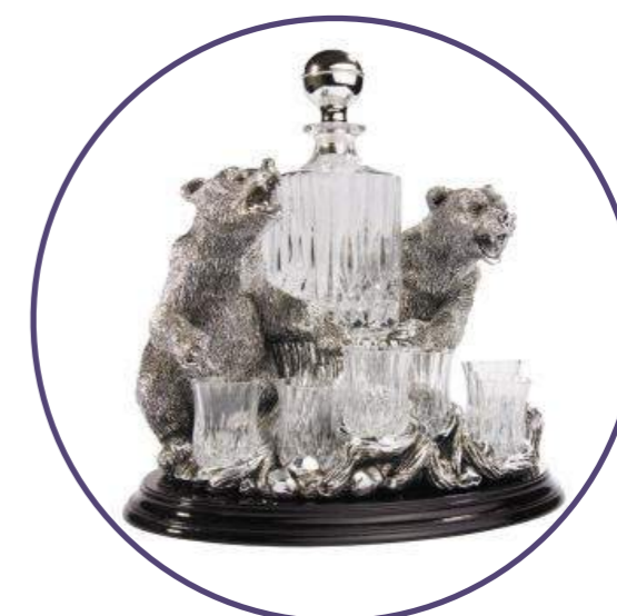
Набор для водки